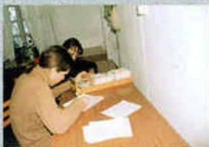
Работа в научной библиотеке г. Тобольска