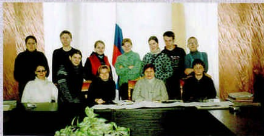
В Российском государственном историческом архиве С.-Петербурга, 2003