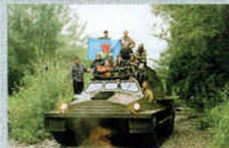
Экспедиция на Камчатке, 2003 г.