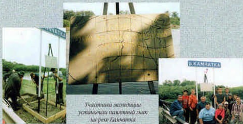
Участники экспедиции установили памятный знак на реке Камчатка

В январе 2004 г. участники экспедиции рассказали о своем путешествии на научно-практической конференции «По следам забытой экспедиции». Одноименная работа стала лауреатом Всероссийского открытого творческого конкурса «Бороться и искать, найти и не сдаваться», посвященного 100-летию со дня рождения В.Каверина. На фестивале «Юные таланты Московии» видеофильм воспитанников МосгорСЮТур «Наша Камчатка» получил Гран при – «Московский кораблик мечты».