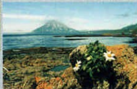
Экспедиция побывала на Курилах, в Парамушир, залив Лужина