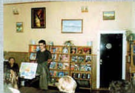
На конференции в библиотеке г. Эссон, Камчатка, 2003

А в 2003-2004 гг. туристско-краеведческому отряду МосгорСЮТур «Азимут» удалось пройти отдельные участки маршрута Лужина и Евреинова, побывать в Тобольске, на Камчатке и Курилах – в тех точках, которые были нанесены на карту России во время экспедиции 1719-21 гг.