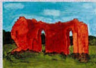
Картина, нарисованная минеральными красками, приготовленными в походных условиях