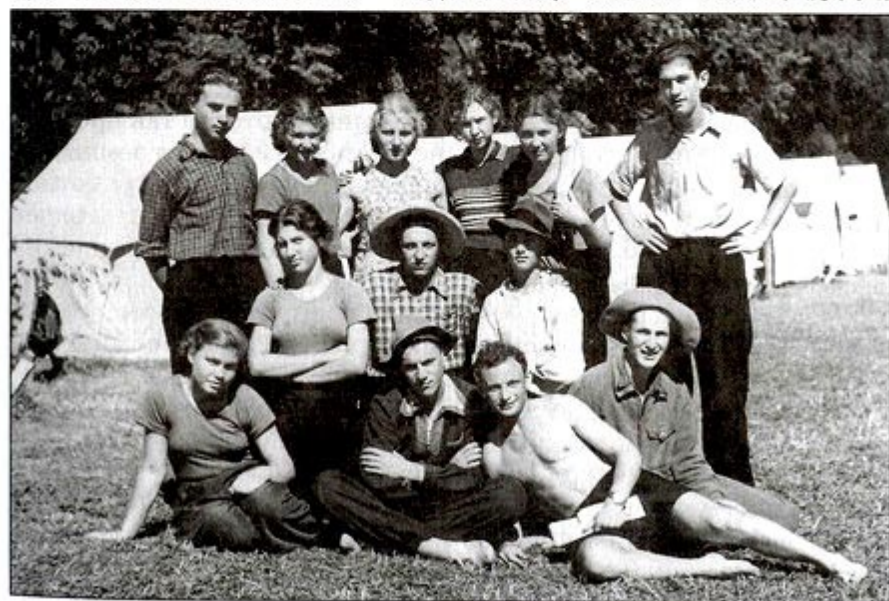
Поляна ДЮТа в 1950-е годы. Крайний слева стоит автор статьи

Походы были интересные: кроме тех, что привлекали «любителей костра и солища», были походы по историческим местам, связанные с древней и современной историей Дмитровского края. Древний Дмитров с крепостными его валами, могилы воинов Великой Отечественной войны – тогда в конце 1940-х – начале 1950-х