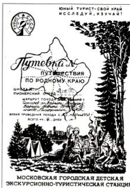
Путевка в МосгорДЭТС

Прошло более 50 лет с того времени, когда я впервые переступил порог ДЮТ – Дома Юного туриста, многие детали стерлись в памяти, однако все, что связано с ДЮТом, относится у меня по-прежнему к числу самых светлых воспоминаний юности.